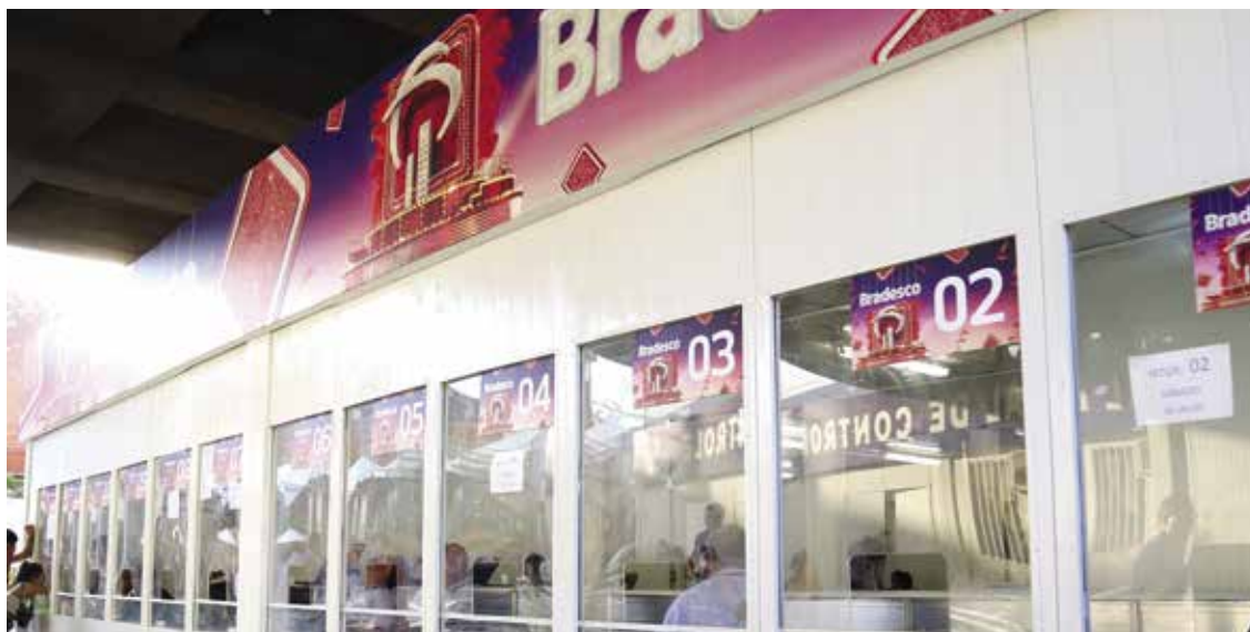
A Central LIESA atenderá na retirada de ingressos no estande montado atrás do Setor 11.

É PERMITIDO LEVAR - O espectador poderá levar até 02 (dois) vasilhames plásticos de 500 ml com bebida (água, suco, refrigerante ou cerveja) e até 02 (dois) itens de alimentação (fruta, salgado ou sanduíche).